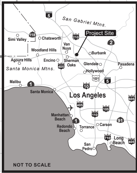
Project Location Map