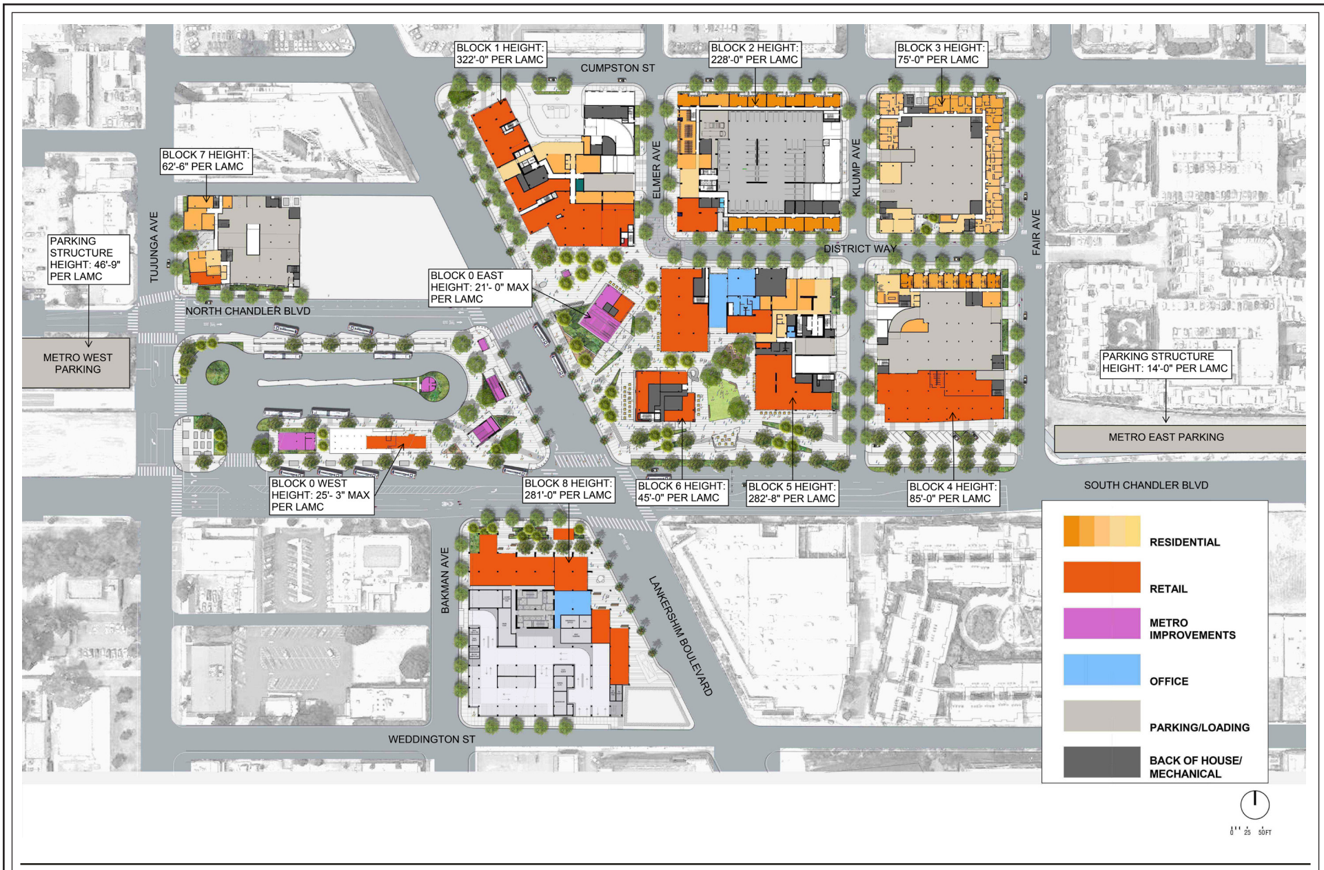
Conceptual Site Plan—Ground Level and Block Heights